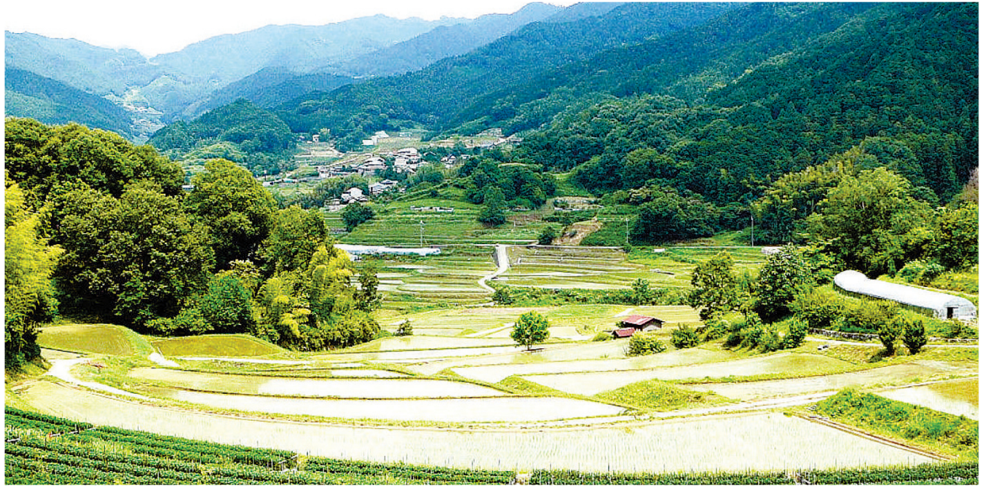
明日香村に広がる棚田

歴史的な遺構と並び、その自然の魅力の一つである飛鳥。しかし「自然の恵み」として得られている農産物などは、全国的には知られていないものも少なくない。そこで、聖心学園中等教育学校(奈良県橿原市)で学んでいる私たちが同県明日香村の自然を調べてみた。