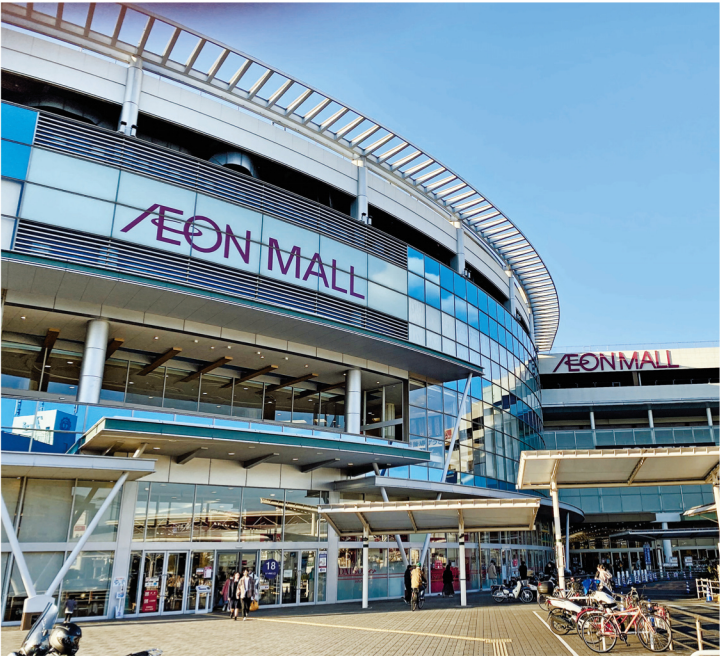
橿原市で最も人気のあるショッピングモール、イオンモール橿原

一方、幹線道路や大きな国道が通っているので車やバイクの騒音が気になることや、道幅が狭く車のすく横を通らなければならない。